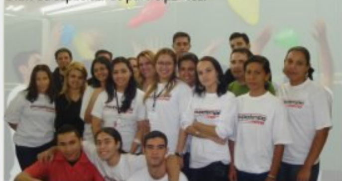
Avaliação da Dinâmica de Grupo

O Treinamento realizado em nosso cliente PoupaTempo nos dias 23 e 24/04/08, teve como objetivo apresentar e desenvolver os temas "Motivação e Trabalho em equipe" a fim de capacitar os participantes.